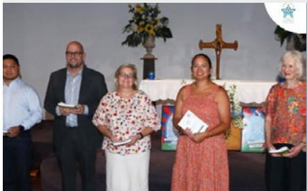
NUEVA ZELANDA: NUEVOS MIEMBROS DE LA JUNTA DIRECTIVA DE LAS ESCUELAS MARISTAS EN AOTEAROA