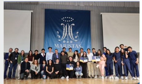
MÉXICO: 3ª FERIA DE EMPRENDIMIENTO 2026 – COLEGIO MÉXICO ACOXPA

Dame de Lourdes de Jbail-Amchit y el Collège Mariste Champville. Su misión es “guiar a los jóvenes hacia los valores fundamentales, construir un mundo mejor y ayudarles a conocer y amar a Jesucristo”.