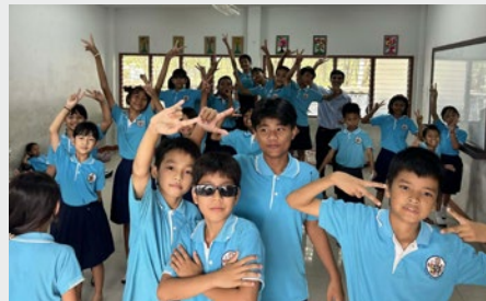
TAILANDIA: MARIST LEARN CENTER, BANGKOK