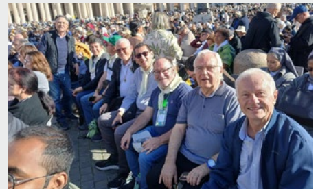
VATICANO: HERMANOS MARISTAS PARTICIPAN EN EL JUBILEO DE LA VIDA CONSAGRADA

Se han ido creando eventos de sensibilización coincidiendo con fechas señaladas (Día Derechos Niño – 20 noviembre, Día Montagne -28 octubre, Día Voluntariado – 5 diciembre, Tiempo de la Creación...).