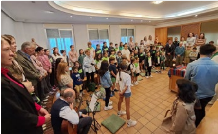
ESPAÑA: COLEGIO CHAMBERÍ – EUCARISTÍA COLEGIAL