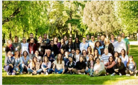
ARGENTINA: TRAYECTO DE FORMACIÓN PARA DIRECTIVOS NUEVOS