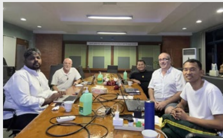
FILIPINAS: REUNIÓN DEL CONSEJO EN MAPAC