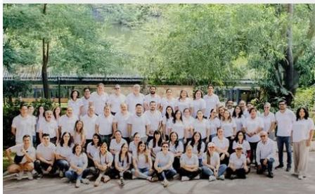
MÉXICO: JORNADA CHAMPAGNAT 2025 – MARISTAS DE MÉXICO CENTRAL