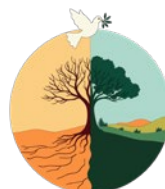
Jardín de la Paz Isaías 32:14-18

Con ese espíritu, les ofrecemos esta Oración Marista para la Fiesta de San Francisco. Este año, la festividad cae el sábado, así que los invitamos a ofrecer el servicio en un horario que sea conveniente para sus comunidades. Durante la oración, también los animamos a asumir los compromisos comunitarios definidos en la Plataforma de Acción Laudato Si’, mientras conmemoramos el décimo aniversario de la encíclica.