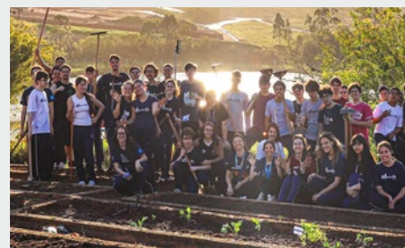
BRASIL: COLÉGIO MARISTA GRAÇAS – CONSTRUCCIÓN DE UN HUERTO COLECTIVO