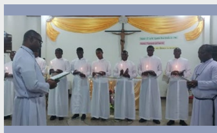
GHANA: EL NOVICIADO DE KUMASI RECIBIÓ A NUEVE NOVICIOS