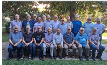
CASA GENERAL: HERMANOS DEL PROGRAMA AMANECER 2025