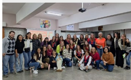
ARGENTINA: VISITA DEL EQUIPO DE ANIMACIÓN DE LA ESPIRITUALIDAD AL COLEGIO MARISTA SAN LUIS DE LA PLATA