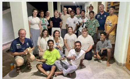
TIMOR ORIENTAL: MARISTAS DE BAUCAU DAN LA BIENVENIDA A ESTUDIANTES DEL CATHOLIC COLLEGE SALE